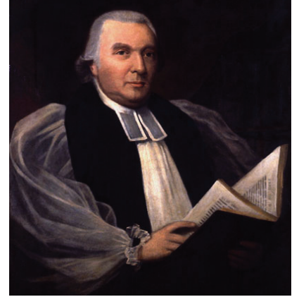
Retrato de Samuel Seabury por Raalph Earl (1751-1801) que forma parte de la colección Nacional de Galería de Retratos de la Institución Smithsonian.